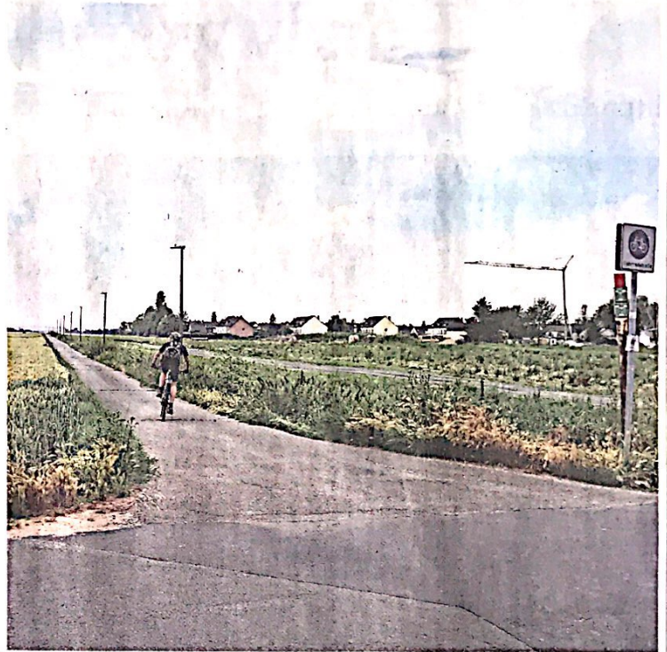
Die Linie 7 endet in Zündorf an der Wahner Straße (Bild links). Die Porzer Politiker fordern eine Verlängerung der Stadtbahnlinie bis nach Langel, die Trasse könnte zu Beginn parallel des Feldweges Zum Stumpfen Kreuz (Bild rechts) verlaufen.